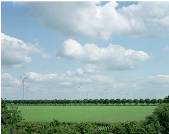
E.4 IN AFWACHTING 80 x 64 cm Almere Oosterwold, 2012