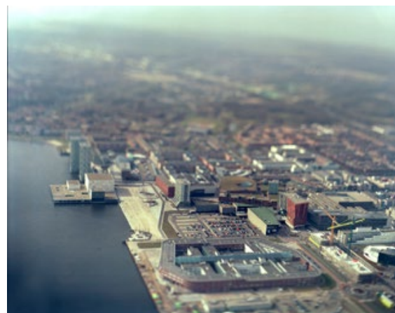
D.2 ZO MOOI ALS HET OOGT 70 x 55 cm Almere stadshart, 2010