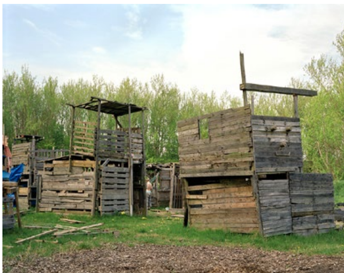
F.5 DE ECHTE VRIJHEID DIE IK AANTROF 100 x 78 cm Jeugdland, Almere Haven, 2010