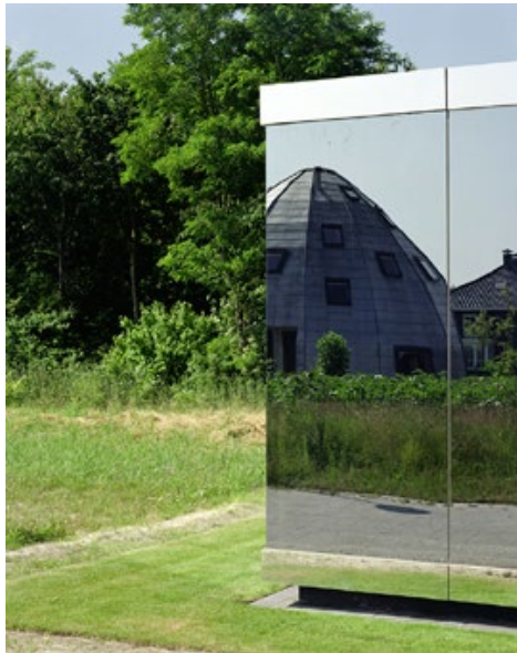
F.4 ZONDER TITEL 78 x 100 cm Eenvoud, Almere, 2012