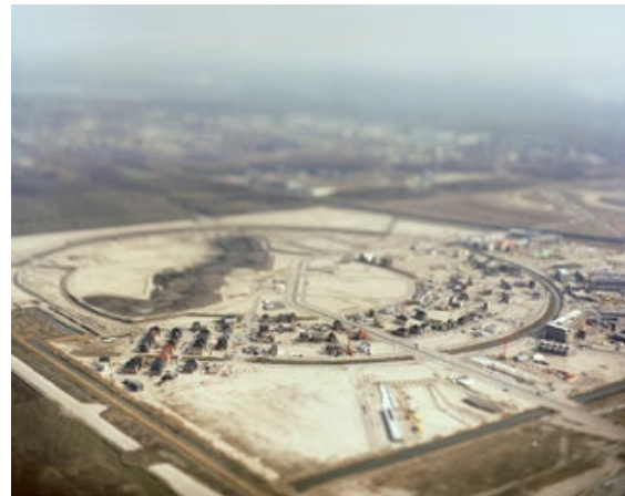
D.1 TER LAND EN IN DE LUCHT 110 x 88 cm Almere Homerus Kwartier, 2010

Het stadscentrum vormt hiervan de tegenhanger: tegenover 'zegt u maar wat u wilt' staat 'kijk eens wie wij zijn'. De gemeente gaat hiermee de regionale en zelfs internationale concurrentie aan. Toch is ook hier de tijdsfactor van grote betekenis. De eerste generatie ontwerpers had de visie om het centrum vrij te laten voor latere invulling. Dit verschafte de vrijheid om met heel andere ideeën en middelen dan destijds voor handen een identiteit aan Almere toe te voegen.