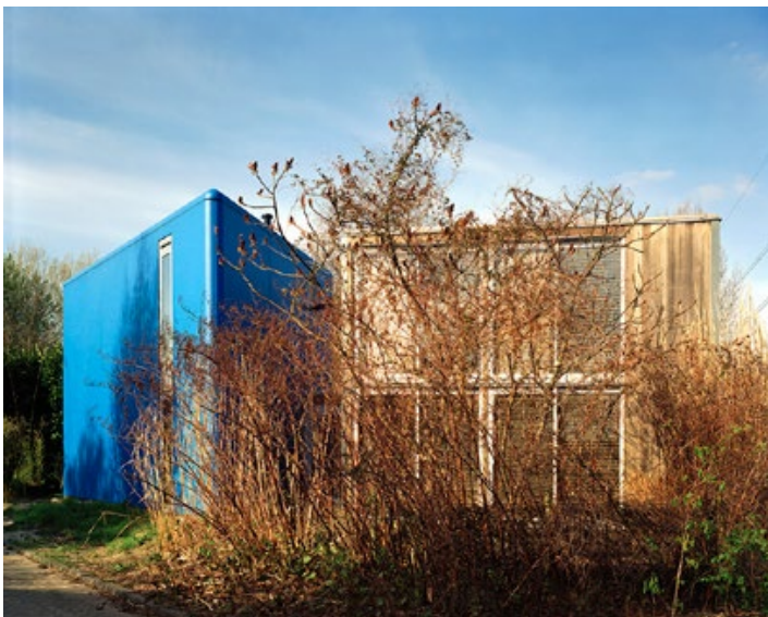
F.7 IN TWEEDE INSTANTIE (TOEGEVOEGDE BLAUWE VORM) 110 x 88 cm De Fantasie, 2010