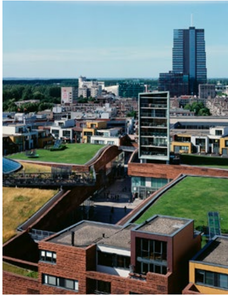
D.3 PORTRET VAN EEN NEW TOWN 78 x 100 cm Almere, 2012