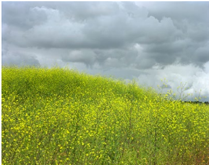
FREEDOMLAND Warande, Lelystad Zuid, 2012

Deze gele duinen ten zuiden van Lelystad roepen de bloeiende koolzaadvelden in herinnering als opmaat tot droog land. Aan de horizon is nog net de nieuwe natuur en een bouwkraan zichtbaar als tekens van gebruik.