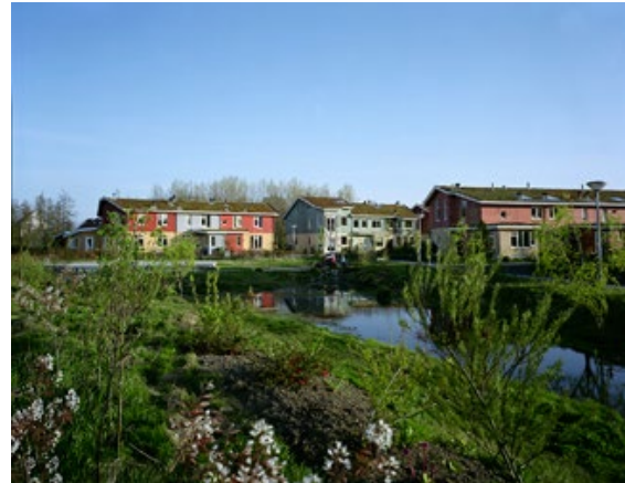
F.2 WIL JE HIER NIET OPGROEIEN? 100 x 78 cm Almere Buiten, 2012