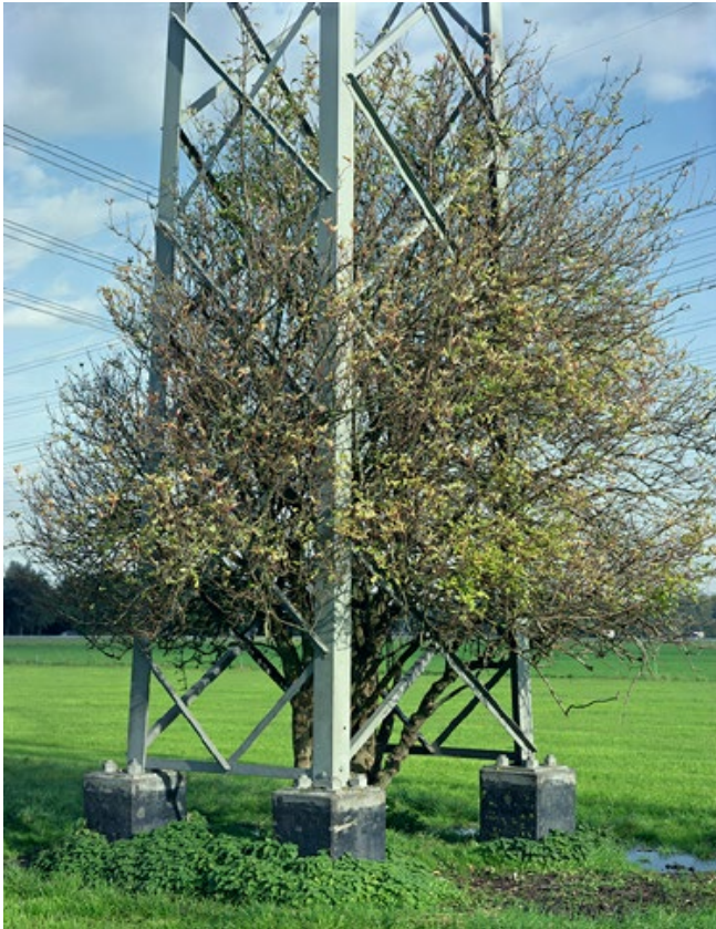
ZONDER TITEL Rivierduinen, Lelystad, 2012