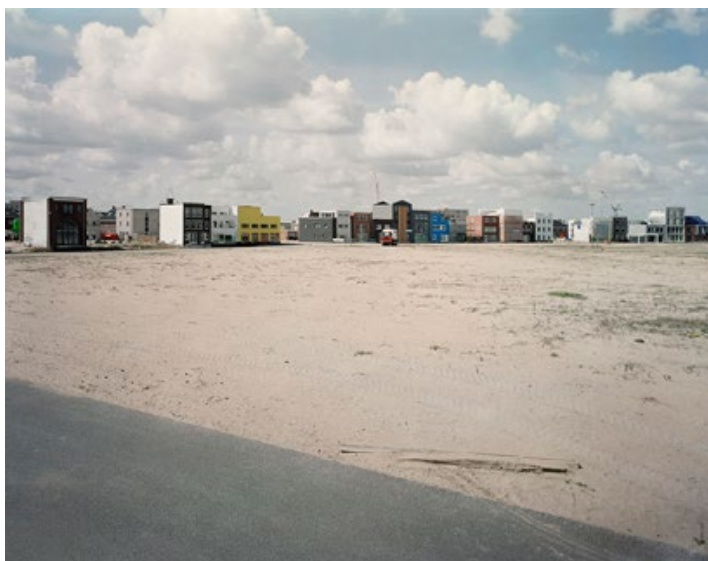
D.4 DROOM ONTMOET BELOFTE 80 x 64 cm Almere Homerus Kwartier, 2011