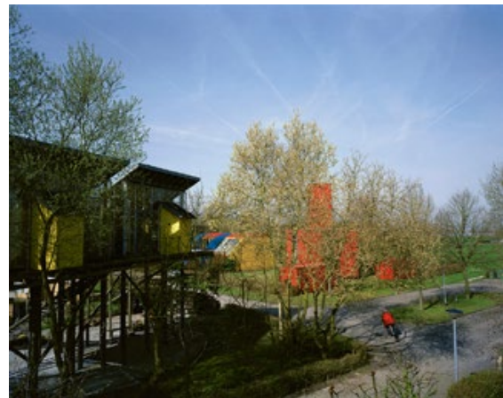
F.3 AFWIJKEN ALS NORM 110 x 88 cm De Realiteit, 2010