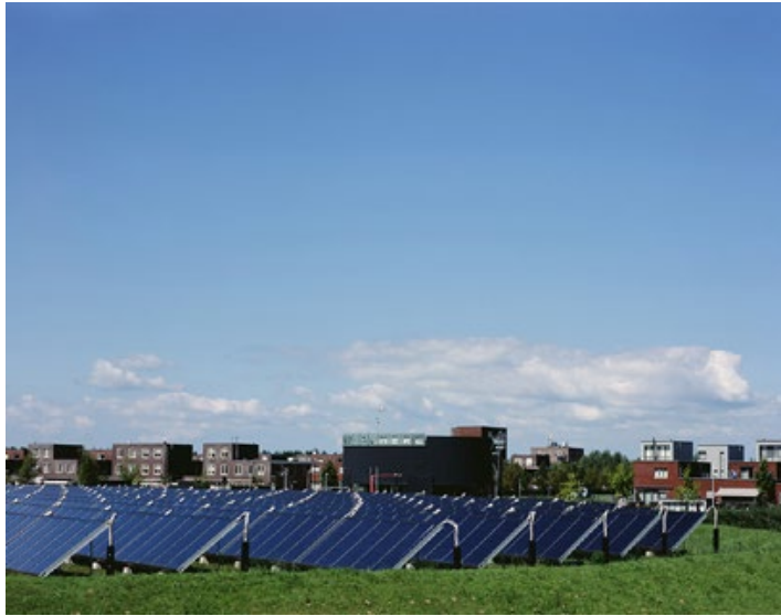
E.3 ZONNE-EILAND 100 x 78 cm Almere Norderplassen West, 2012