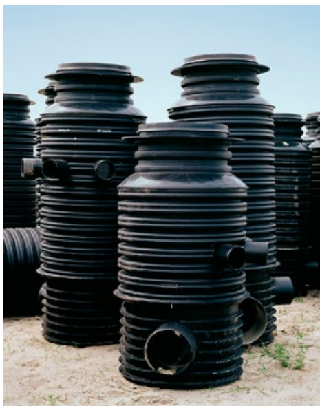
E.6 ZONDER TITEL, ZONDER PLAATS 86 x 110 cm Zonder plaats, 2012