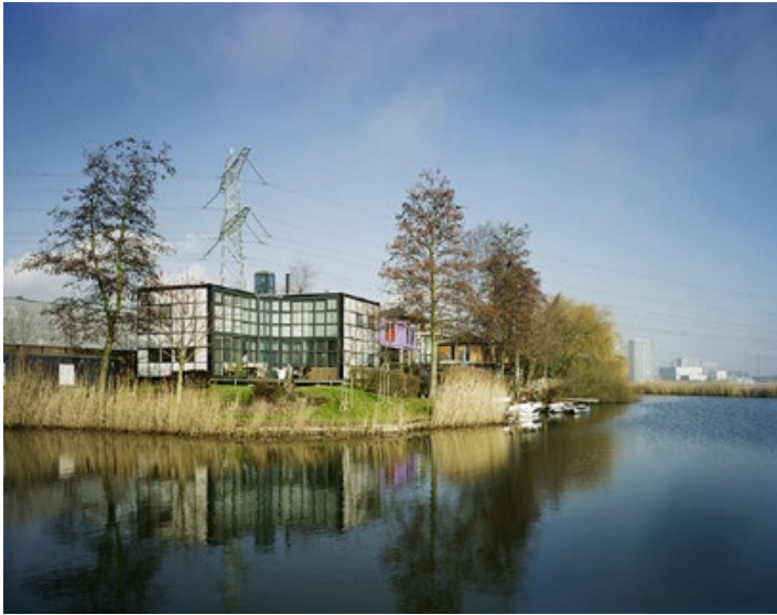
F.6 CULTUUR KUBUS 100 x 78 cm De Realiteit, Almere 2011