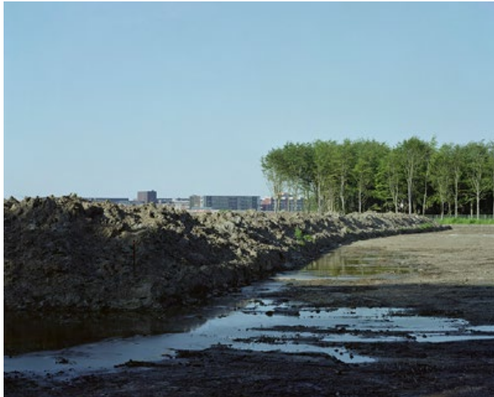
E.5 HOLLANDSE HEUVELRUG 80 x 64 cm Almere Duin, 2012